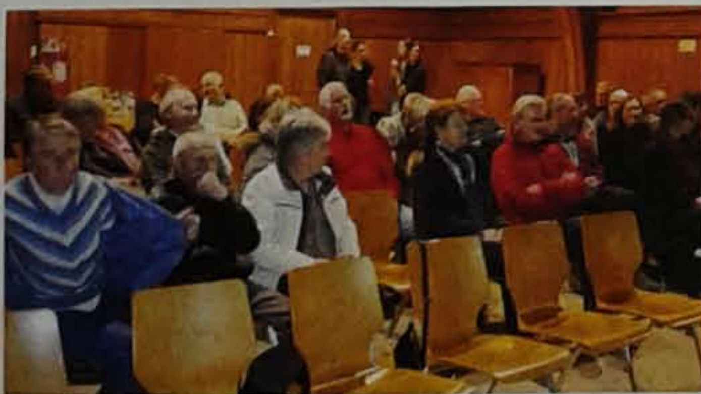
Vue du public

VOUS ORGANISEZ UNE FÊTE... ...et nous, nous reprenons les éventuels surstocks de boissons achetées chez nous !