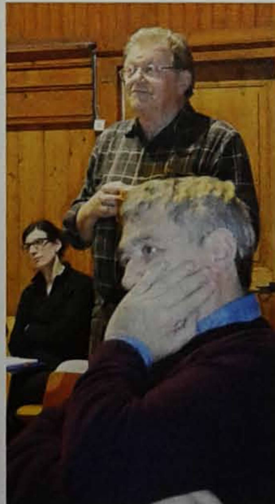
Un citoyen de Gorgier en plein débat